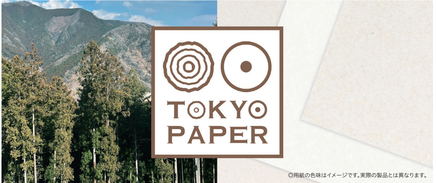
◎用紙の色味はイメージです。実際の製品とは異なります。