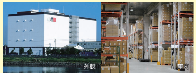
当社物流センター「Sakura Cube」(新木場)

お預かりした物品は東京都江東区新木場にある当社物流センター(Sakura Cube)で保管。4,650パレット相当の広大なスペースの各区画に防犯カメラを設置。各倉庫フロアへの入場者制限の実施や、機械警備システムなども設置し、堅牢なセキュリティによる防犯体制を整えています。