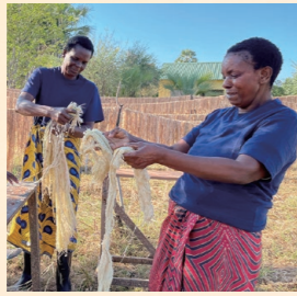
▲バナナの茎の繊維の乾燥作業を行っているエンフエ村の女性たち

アフリカ ザンビアのエンフエ村に住む人たちが、バナナの茎の繊維に含まれる水分を除去し、乾燥させる作業を行っています。これらの仕事から得た収入で、安全な飲み水や栄養のある食事を手に入れたり、マラリアを予防するための蚊帳を買ったり、病院に行ったりすることができるようになりました。