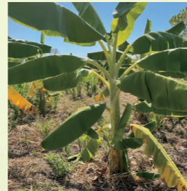
▲オーガニックバナナ畑

バナナペーパーは、今までは収穫時に廃棄されるだけだったバナナの茎の繊維を利用して作られています。通常の樹木が10年から30年で成長するのに対し、バナナの茎は1年以内に再生成長するため、より早い循環で活用できます。